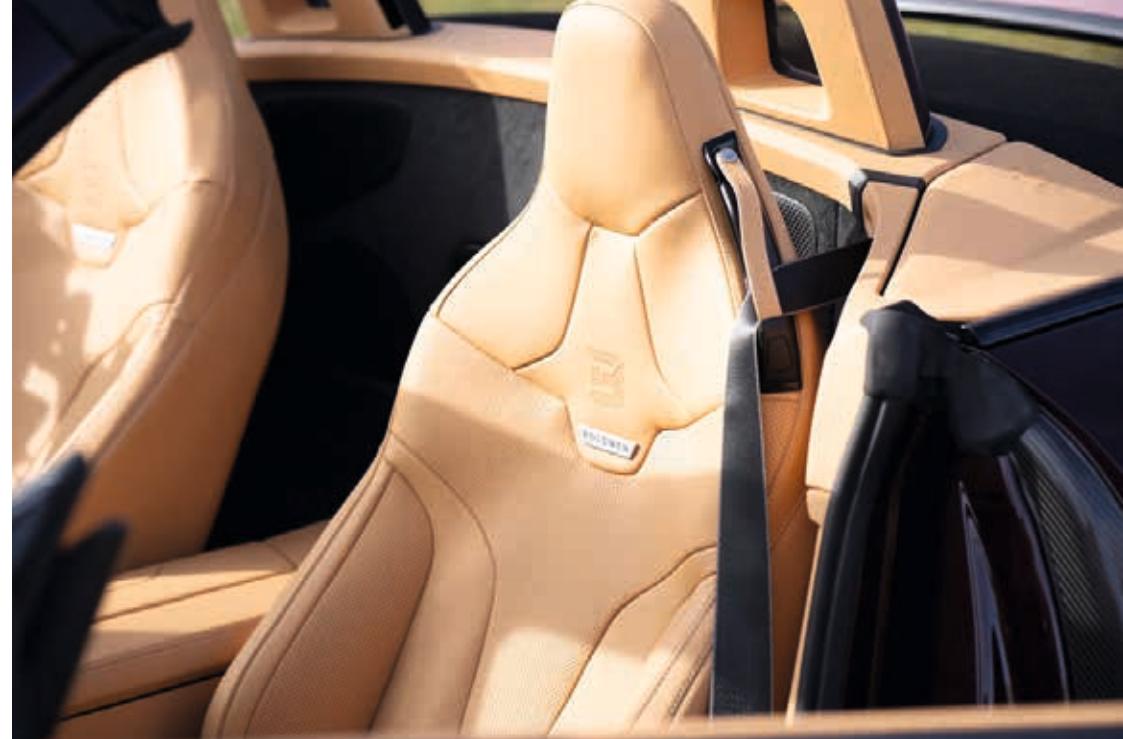
Links und Rechts: Sportsitze STYLE, verschiedene Lederkombinationen To the left and right: Sport seats STYLE, different leather combinations