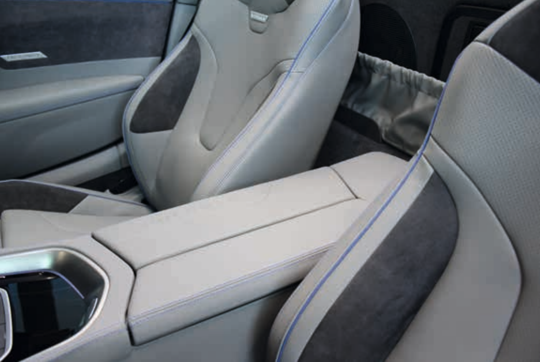
Links: Sportsitze STYLE (Sonderausstattung) To the left: Sport seats STYLE (special equipment)